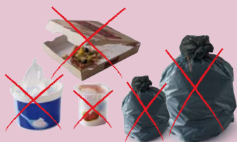
sacs poubelles, pots de yaourt, pots de crème fraîche