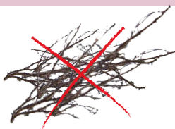
branches de haies et d'arbustes taillées