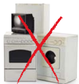
frigo, TV, ordinateur machine à laver

➤ DECHETERIE ou SERVICES TECHNIQUES DE VOTRE VILLE