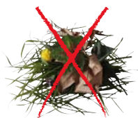
déchets végétaux, feuilles mortes, herbes de tonte