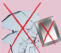
verre : miroirs, vitres cassées (selon dimension)